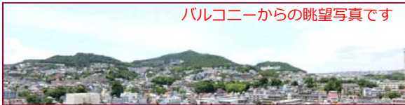
バルコニーからの眺望写真です