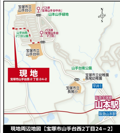
現地周辺地図【宝塚市山手台西2丁目24-2】