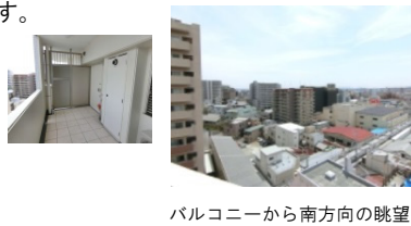
バルコニーから南方向の眺望